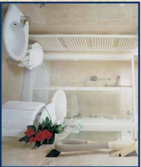
Tipoliteo CALDARI - Cattolica